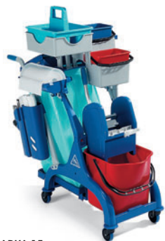
ARKA 15 FI 6LP1285A