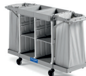
HOTEL ALPHA 5301-06 FI 0300HA5301U06