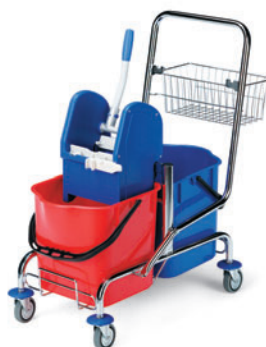
wózek FILMOP FI 8018