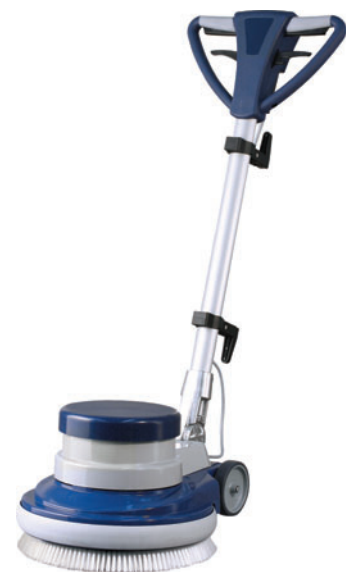
Roto 200 L

Duplex to wielofunkcyjne urządzenia czyszczące, przeznaczone do czyszczenia i konserwacji posadzek twardych oraz tekstylnych. Maszyna czyści, dezynfekuje, konserwuje i poleruje powierzchnie twarde (gres, kamień, ceramika, drewno, linoleum i inne tworzywa sztuczne epoksydowe), pierze, czyści i czesze dywany.