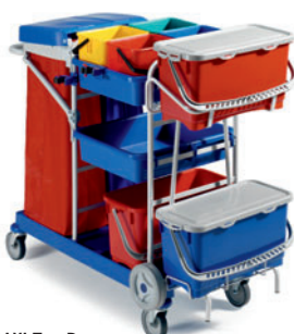
MAXI Top-Down FI MP8020A