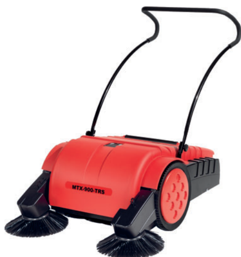
Matrix 900 TRS

Matrix 900 TRS to zamiatarka ręczna, przeznaczona do małych obiektów zewnętrznych i wewnętrznych - parkingów, chodników wewnętrznych, placyków, obiektów handlowych (również powierzchni tekstylnych) itp.