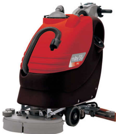
Ruby 55 B / BT

BKF Baby 35 B / BX to najmniejsze zmywarki w ofercie BKF. Prowadzone przez operatora, zasilane bateryjnie (wersja 35 B) lub bateryjnie-kablowo (wersja 35 BX). Nadają się do codziennej pielęgnacji i zmywania małych obiektów, wąskich przejść itp. Nowatorskie rozwiązanie zasilania w wersji 35 BX pozwala na pracę non-stop: na bateriach (1-2 h) lub na kablu (ładowanie baterii w trakcie pracy).