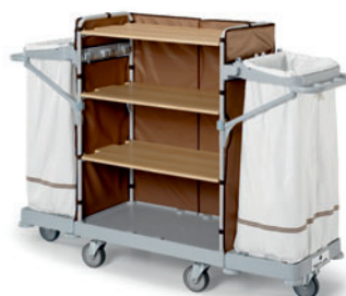
HOTEL 813 FI HP3363E