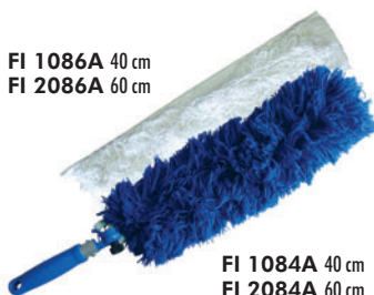
FI 1086A 40 cm FI 2086A 60 cm