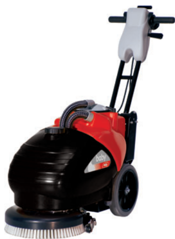
Baby 35 B / BX